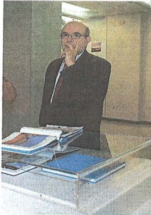
En la exposición.

La muestra estará abierta en la sala, propiedad de la institución provincial, hasta el 5 de mayo y la intención de la Diputación es ofertar esta muestra a las Casas de Palencia en toda España para que las imágenes capturadas de cada rincón de la provincia y los textos de los escritores palentinos recorran la geografía española y atraigan a los turistas.