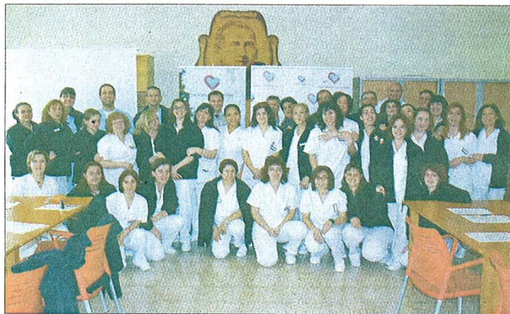
Se hizo entrega de los diplomas a los 30 alumnos, que les habilita para trabajar como Auxiliares de Enfermería.

«En este periodo de crisis, es imprescindible reforzar y concentrar recursos en la capacitación profesional», señaló Arellano, quien explicó que las acciones for-